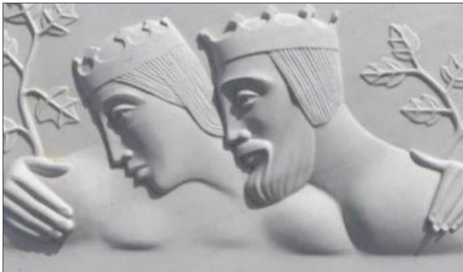
Slika 1: Vladimir i Kosara u reljefu, djelo makedonskog vajara Tome Adžijevskog ( Istorija i Balkan ).

– požrtvovana, pokorna i poslušna, a s druge Jakvinta, spletkasica, za koju Subotić (2022, 315) navodi da je “u Dukljaninovom izlaganju postala inicijator dubljeg unutrašnjeg sukoba dinastije”.