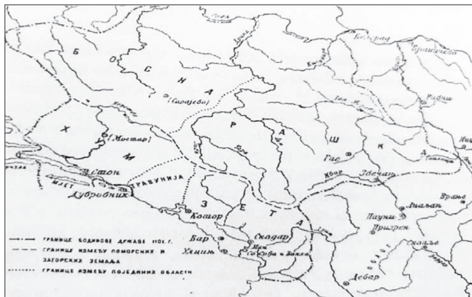
Slika 2: Prostor Duklje za doba Bodinove vladavine (Šekularac, 2007, 56).

Bodin Vojislavljević (1082.–1101.) vladao je Dukljom tijekom posljednjih desetljeća XI. stoljeća. Još za života Bodinovog oca, Mihaila (oko 1046.–1082.) Duklja je 1077. godine postala kraljevina. To saznajemo iz jednog pisma pape Grgura VII., u siječnju 1078. godine, upućenog Mihailu Vojislavljeviću u kome ga oslovljava kao rex Sclavorum . Bodin se za vrijeme vladavine svog oca nametnuo kao važan akter dinastije Vojislavljevića. Bodin je predvodio ustaničku vojsku u Podunavlju