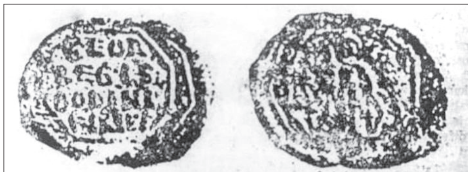
Slika 3: Pečat Đorđa Vojislavljevića, sina kralja Bodina i kraljice Jakvinte (Šekularac, 2007, 60).

Da tijekom razdoblja srednjeg vijeka “žene nisu bile samo pasivni promatrači krupnih političkih događaja i odluka, već su mogle biti u njih aktivno uključene, kao i njihovi muški srodnici” (Premović, 2023, 7) svjedoči i djelovanje kraljice Jakvinte, koja je kao povijesna ličnost imala nesumnjivo veliki utjecaj na povijesne okolnosti tadašnje Duklje, uspijevajući da pomogne svom sinu da osvoji, a potom i obnovi vlast. Također, kraljica je uspjela da ima utjecaj i na vanjske odnose Duklje, diktirajući pravac njezinog djelovanja.